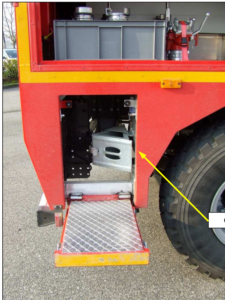
Coffret arrière droit